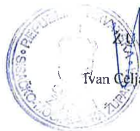
Ivan Čeljak, mag.iur.

Ova Odluka stupa na snagu danom donošenja i bit će objavljena na službenim mrežnim stranicama Sisačko-moslavačke županije.