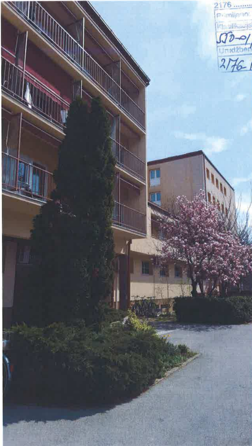
Petrinja, veljača 2019. godine