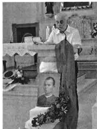
Na 8. danima hrvatskih svetaca i blaženika

»Honorarnu suradnju započeo sam na Radiju Kutina«